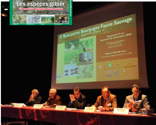
Bourgogne-Nature et les Rencontres Bourgogne-Nature.