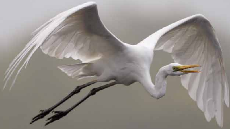
Grande Aigrette, Étang de la Noue, Antully (71)

◀ Mésange à longue queue, Saint-Sernin-du-Bois (71)