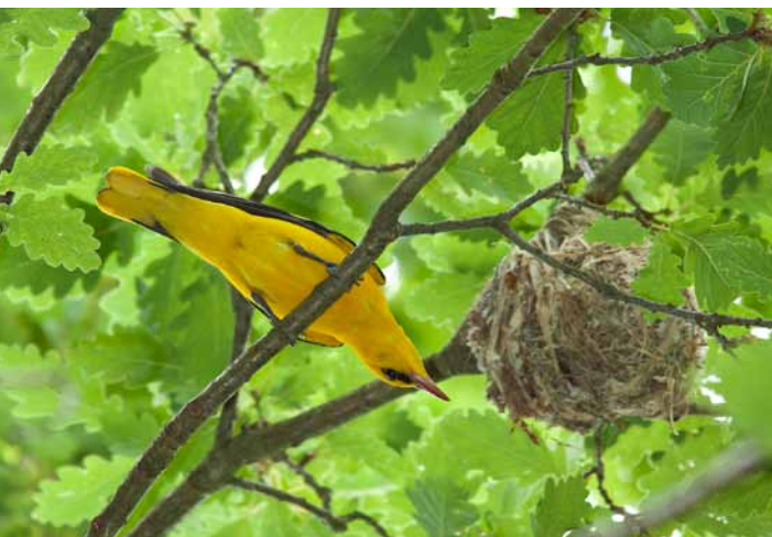
Loriot d'Europe, Saint-Sernin-du-Bois (71)