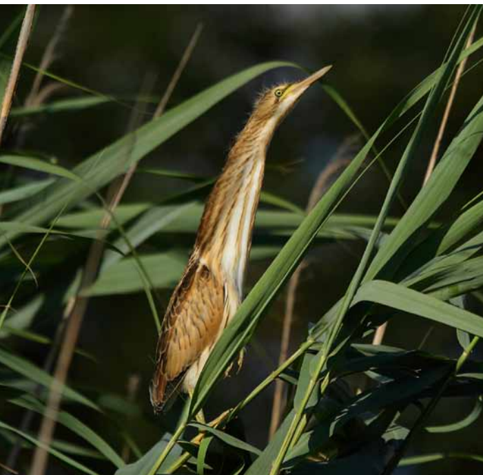
Blongios nain, La Seille, Cuisery (71)