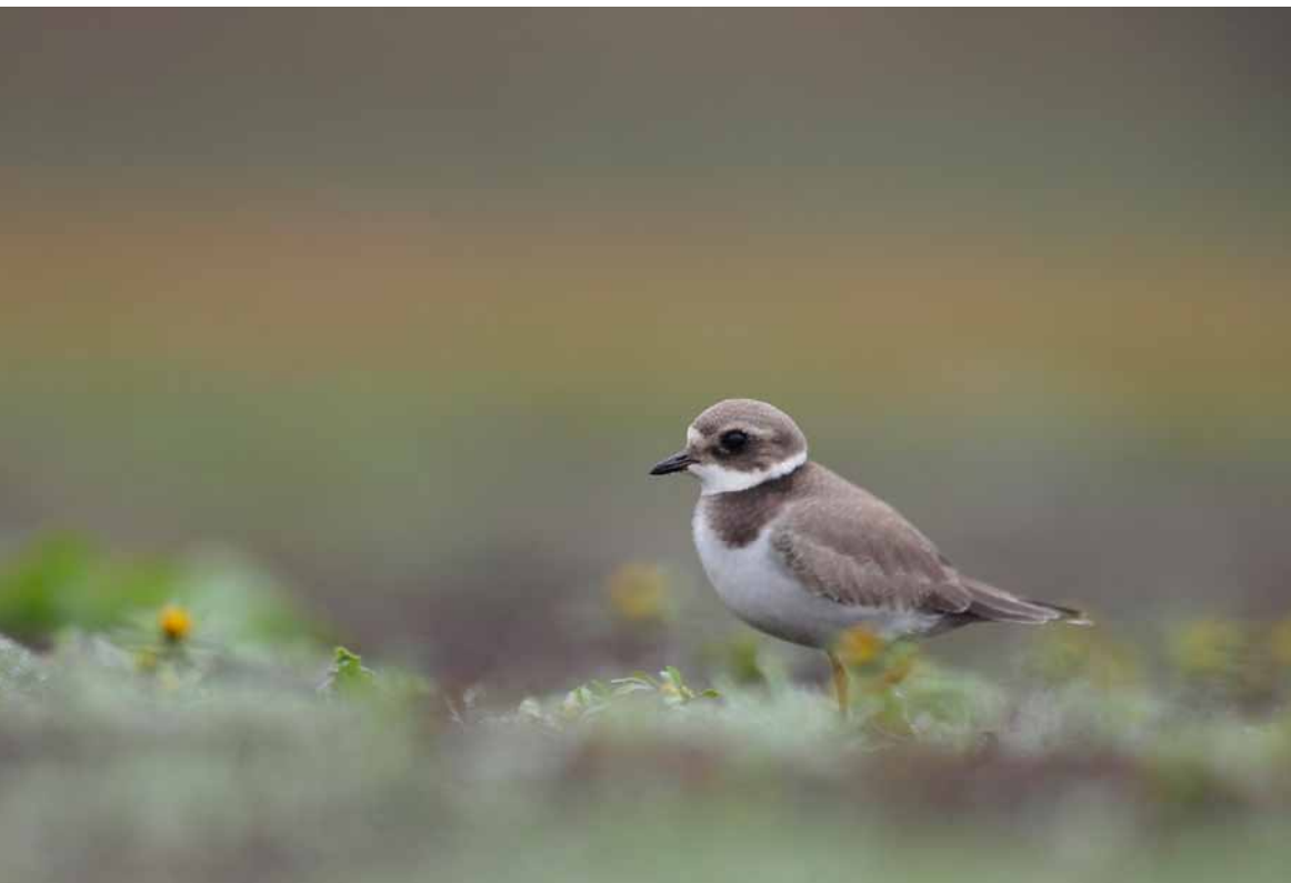
Petit Gravelot, Étang de la Noue, Antully (71)